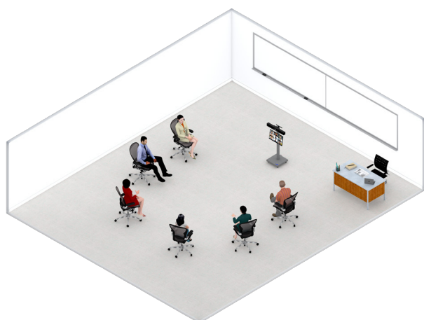
Discussão de caso