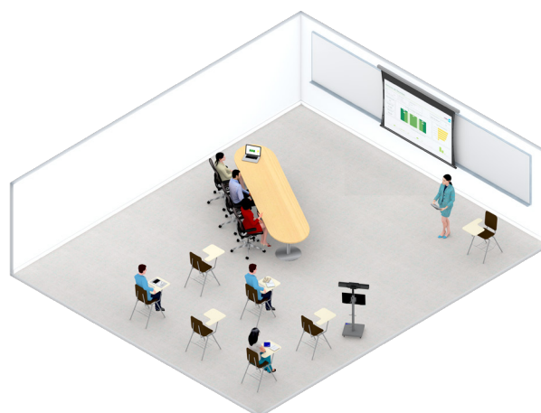
Banca de defesa