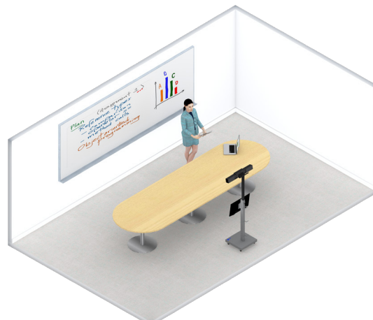
Criação de conteúdo gravado